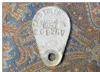
Alu-Fahrradmarke Land Thüringen 1920

Aluminium ist allgegenwärtig. Alle kennen Getränkebüchsen aus Aluminium, kaum eine Küche kommt ohne Alu-Topf oder Alu-Sieb aus, in fast allen Gewerken wird das Metall in Form von Geräten, Werkzeugen und Behältern verwendet, und sogar in Flugzeugen und im Weltraum ist es unentbehrlich.