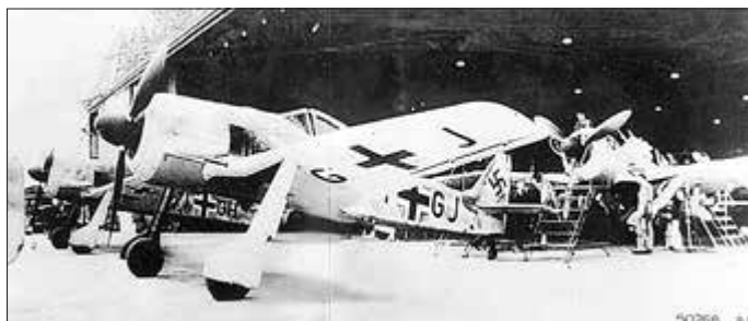
Fw 190, Oschersleben, 1944

Vom Reichsluftfahrtministerium erhält er die Fluglizenz für den Düsenjäger Me 262 und absolviert eine Umschulung auf die Me 262 in Brandenburg/Briest und Burg bei Magdeburg.