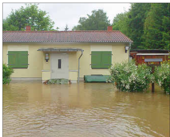
Bild: Alljährlich nach der Schneeschmelze blicken die Sportfreunde besorgt zum Wasserstand der Saale, 2013 stand wieder einmal stand das Wasser vor der Tür des Vereinsheimes.

Ja, aus eigener Erfahrung, hier fehlte teils den Anglern West zum Angler Ost das Verständnis? Genügend Geld in den Kassen regelt alles?