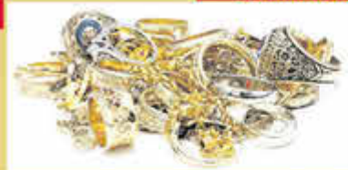
*in Verbindung mit Gold