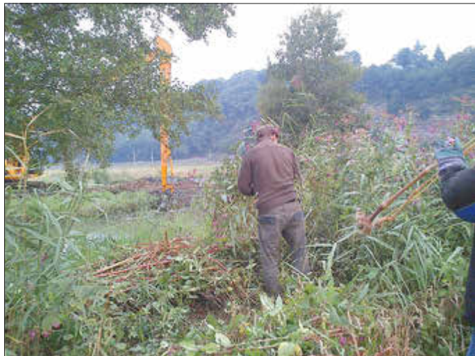
Bild: Baggerarbeiten gegen Verlandung zum Erhalt der Schröders Lache, weitere Beseitigung des Indischen Springkrautes. Dieses entwickelte sich Bundesweit zum Problem heimischer Pflanzen.

Auch war es völlig neu für die Vorstände der Vereine der alten Bundesländer das in den Vereinen der neuen Bundesländer in den Jahreshauptversammlungen Anfang des Jahres Jahresportpläne für das laufende Jahr beschlossen wurden. Planwirtschaft noch immer ala DDR, war es das, was so die Vorstände der alten Bundesländer hierzu empfanden?