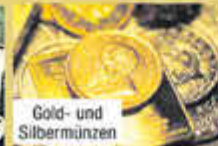
Gold- und Silbermünzen